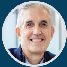
FRANCISCO DE CÁRDENAS